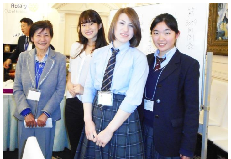
岡崎様と新旧青少年交換学生の3名