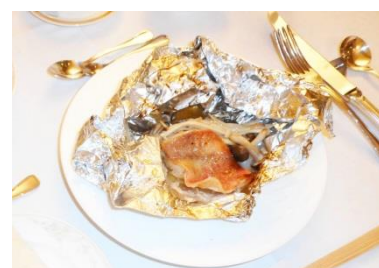
中身はお魚でした