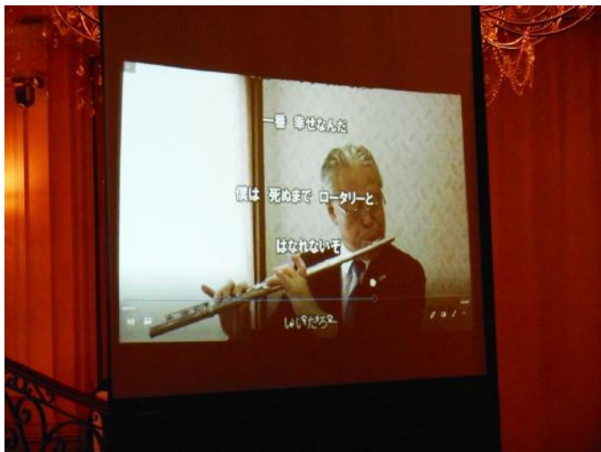
ガバナーのご趣味は、フルート演奏！ 「君といつまでも」をご披露！！