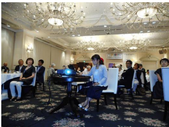
大坪 ガバナー補佐幹事