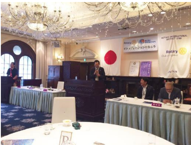
大小原 会長より謝辞