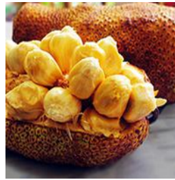
チャン・プダッ Chem Pedak ドリアンの次に強い香りを持つといわれる。ビタミンが豊富で健康にとっても良い