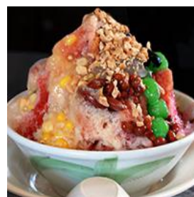
アイス・カチャン