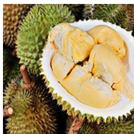
ドリアン Durian 「果物の王様」。 独特の香りと味がある。 慣れるとやみつきに

日本ではあまり手に入らないフルーツがたくさんあります。屋台などで食べることもできますし、スーパーマーケットや市場でも手に入ります。100%フルーツジュースもとてもおいしいです。