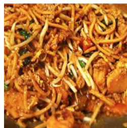
ミー・ゴレン Mee Goreng