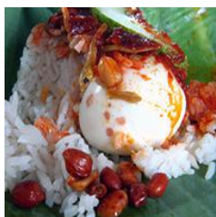
ナシ・レマ Nasi Lemak

多民族国家マレーシアでは、マレー料理・ニョニヤ料理・インド料理・中華料理があります。民族の特徴を活かした料理や多民族ならではの融合した料理もあります。屋台ご飯やフードコートなどではリーズナブルにマレーシア料理が味わえます。