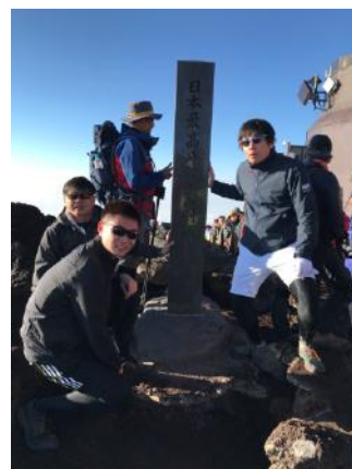
今年の夏、 富士登山に挑戦!!