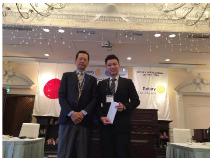
大小原会長より謝辞