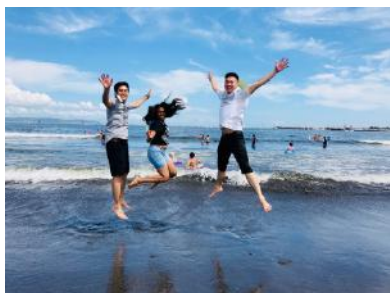
米山クリーンキャンペーン