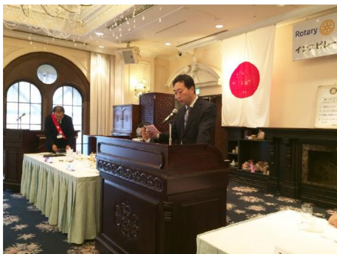
國分会員のスマイル報告