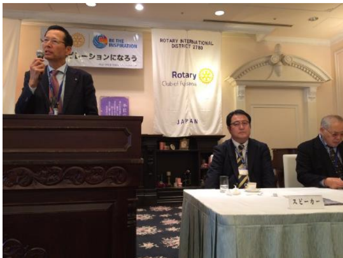
毛利会員の入会推薦者 大小原会長より謝辞