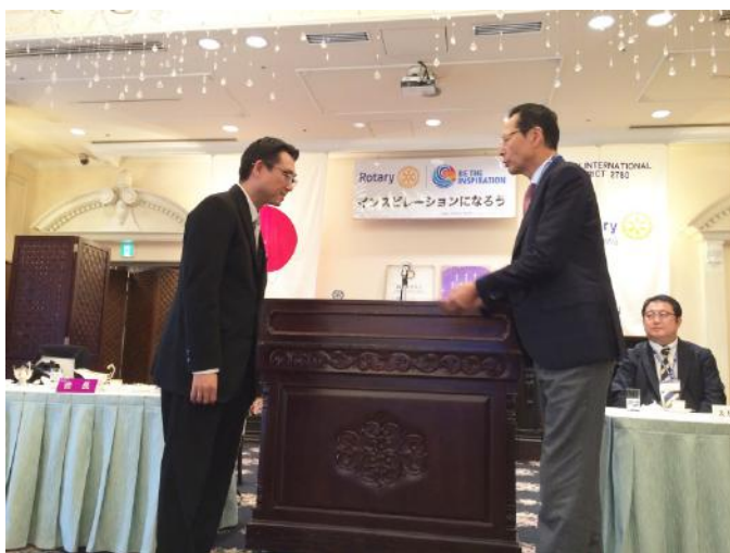
上半期のホテルへのお礼 いつもありがとうございます！