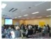
2市1町(藤沢市・茅ヶ崎市・寒川町)での活動①

また、他の団体との共催で、体力増進とストレス開放、親睦をかねてのハイキングなども取り入れて実施してきました(大山街道を歩く・辻堂の旧跡巡り、発掘現場訪問、そのほか)。近年、藤沢市より、住民同士のつながりや支えあいを大切にしながら、人の和を広げ、誰もがいきいきと健やかに暮らせるまちづくりを目的に、多様な地域住民が気軽に立ち寄れる居場所を作ることを目的に開始した、「地域の縁側」事業という制度があります。本会も発足半年後から昨年3月まで指定団体でした。