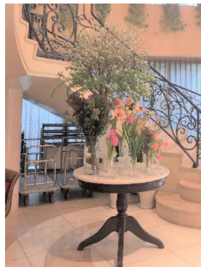
ホテル エントラスホール 上の白いのは猫柳