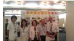
2市1町(藤沢市・茅ヶ崎市・寒川町)での活動④

縁側指定1周年記念ミニフォーラム 「認知症のかたもそうでないかたも安心して暮らせるまちづくりのために」 場所:JAさがみ寒川支店 主催:おれんじリング湘南 後援:藤沢市 茅ヶ崎市 寒川町 藤沢市社会福祉協議会 茅ヶ崎市社会福祉協議会 寒川町社会福祉協議会 内容:寒川町における高齢者対策の現状ほか