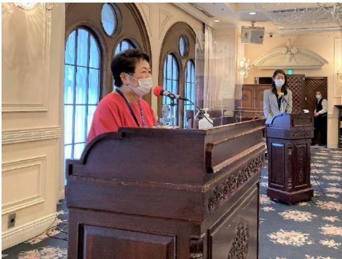
最終例会です。よろしくお願い致します。