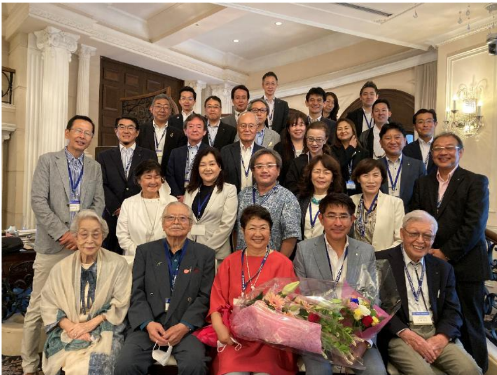
久しぶりの記念撮影です！