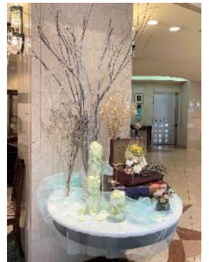
エントランスホールのお花