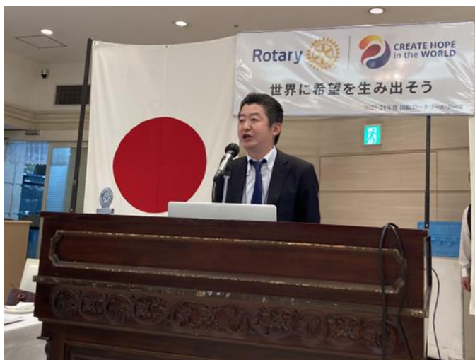
5 月 11 日開催のセミナーについて説明いただき、実際にやっていただきました。