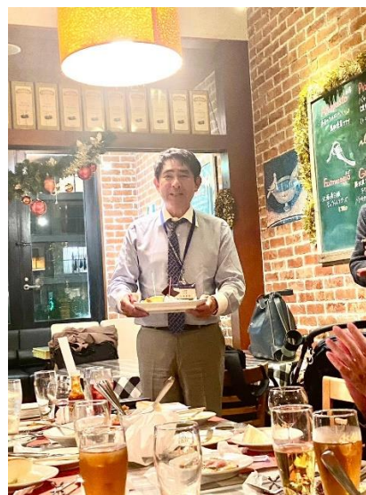
小河会員にサプライズでケーキのプレゼント