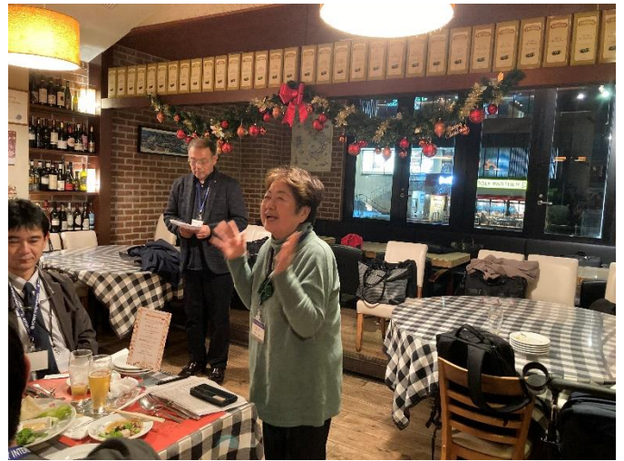
野口会員増強委員長よりご挨拶