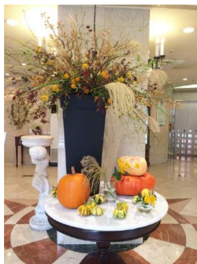
エントランスのお花 かぼちゃが並んでいます