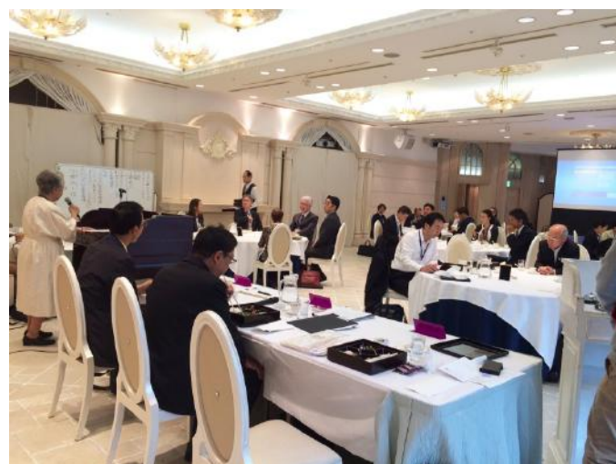
泉会員 小話3分間スピーチ