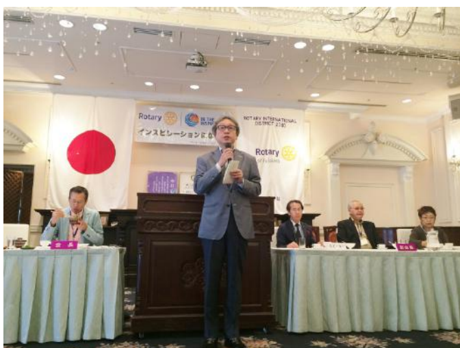
廣島 会員お誕生日メッセージ