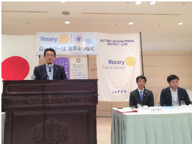
瀧澤クラブ奉仕委員長より