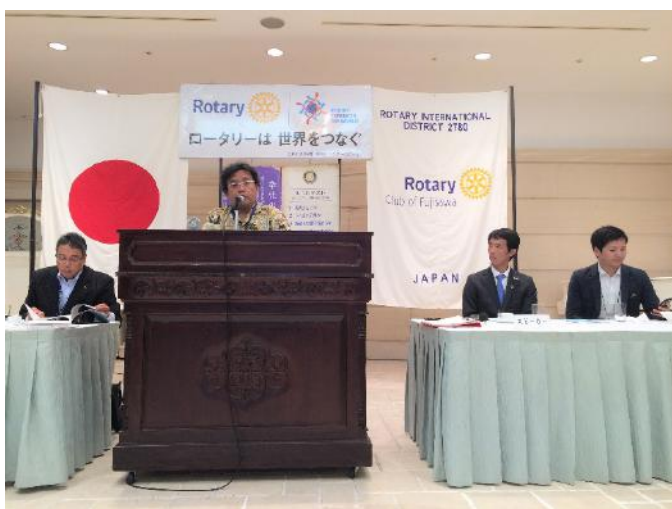
棕梨 青少年奉仕委員長より