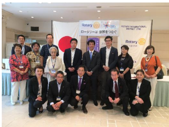
大勢のお客様にお越しいただいた本日の例会