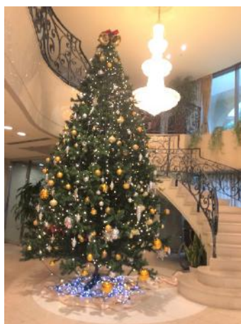
エントランスの クリスマスツリー