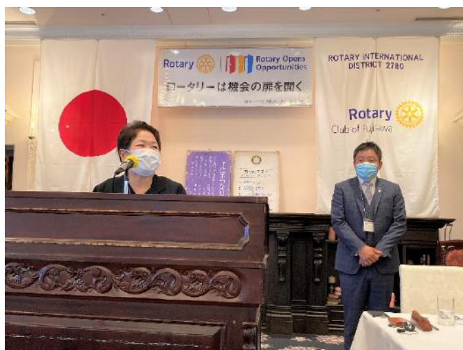
野口会長より謝辞