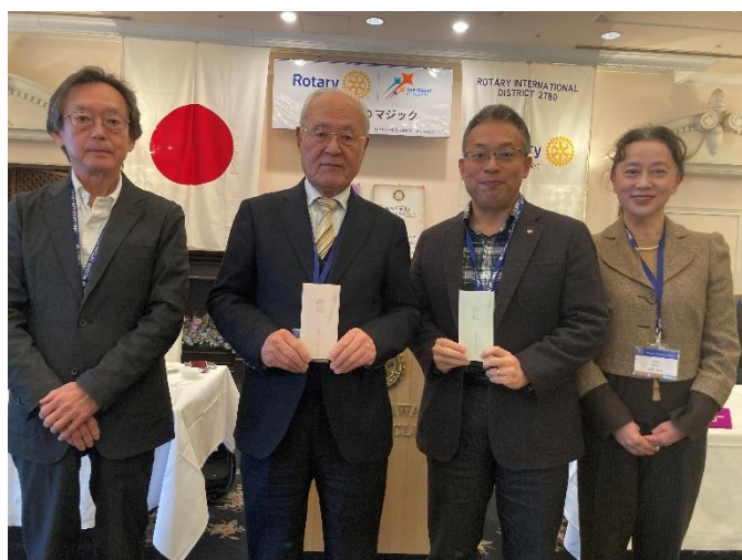
米山奨学金のお渡し